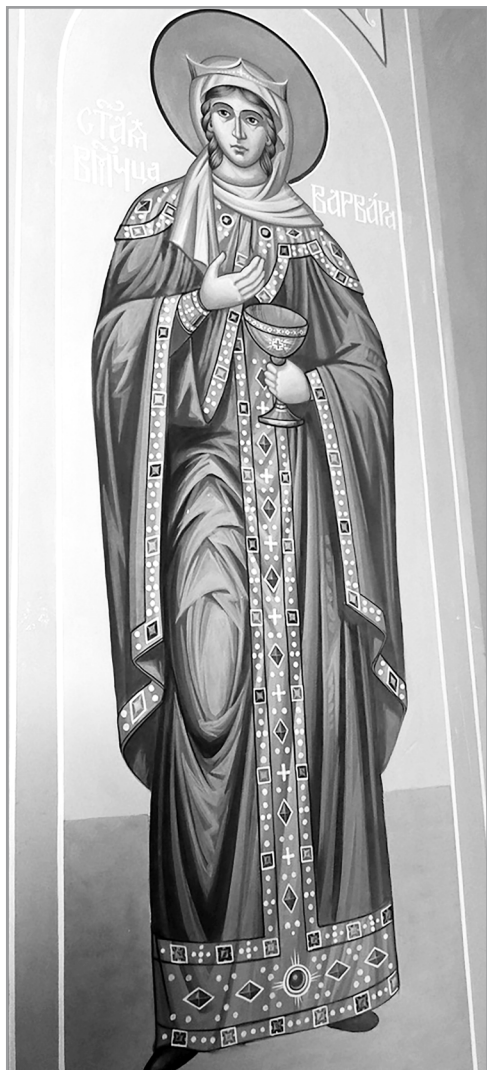
Рисунок 6. Фигура полноформат- ная из левого придела храма Преподобного Сергия Радонежского села Новосергиевка

Художниками коллектива «Долиаль» за два с лишним десятка лет его существования было расписано более пятидесяти храмов в Московской, Костромской, Ивановской, Владимирской, Свердловской, Нижегородской, Курганской, Тамбовской, Псковской, Калужской, Тульской, Оренбургской, Тверской областях, Республиках Мордовия, Карелия и т. д. За это время художники, кроме акрила, пробовали работать силикатом. Более «круп-