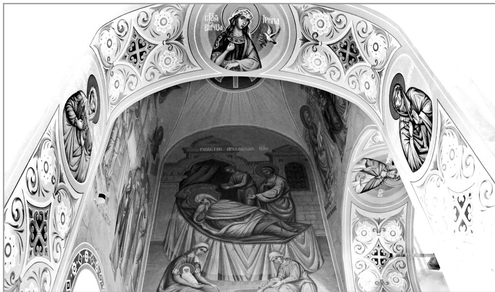
Рисунок 4. Общий план левого придела храма Преподобного Сергия Радонежского села Новосергиевка

Особенностью алтарных стен является центральный сюжет – «Нисхождение Святого Духа» (рисунок 5).