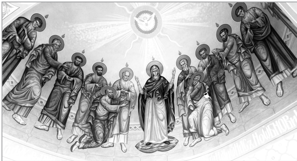
Рисунок 5. Фреска «Нисхождение Святого Духа». Алтарная часть храма Преподобного Сергия Радонежского села Новосергиевка

Иконографическая традиция явственно видна и в строгой, несколько вытянутой пропорции фигур на фреске правого придела «Положение во гроб» (рисунок 8) [2].