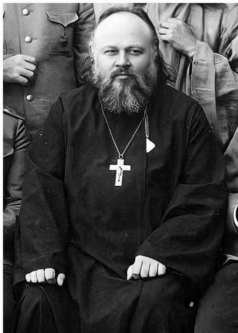
Фото 2. Гринкевич Н. С.

после 1927) (фото 2). Он родился в семье священника с. Репки Рогачёвского уезда Могилёвской губернии (ныне Рогачёвского района Гомельской области Беларуси) Стефана Фёдоровича Гринкевича. Обучался в Гомельском духовном училище, Могилёвской духовной семинарии, а в 1884–1888 гг. – в Санкт-Петербургской духовной академии.