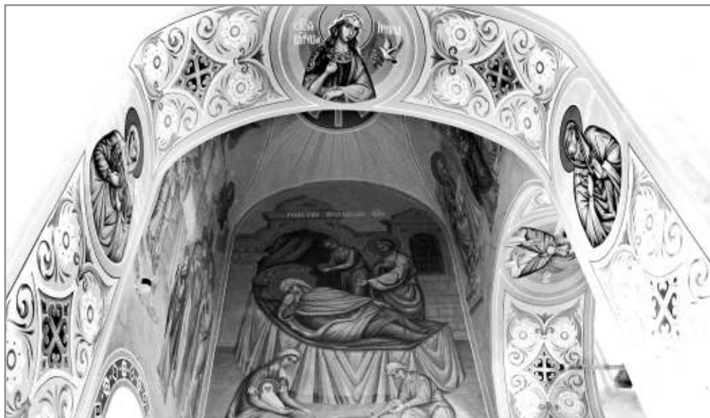
Рисунок 4. Общий план левого придела храма Преподобного Сергия Радонежского села Новосергиевка

Особенностью алтарных стен является центральный сюжет – «Нисхождение Святого Духа» (рисунок 5).