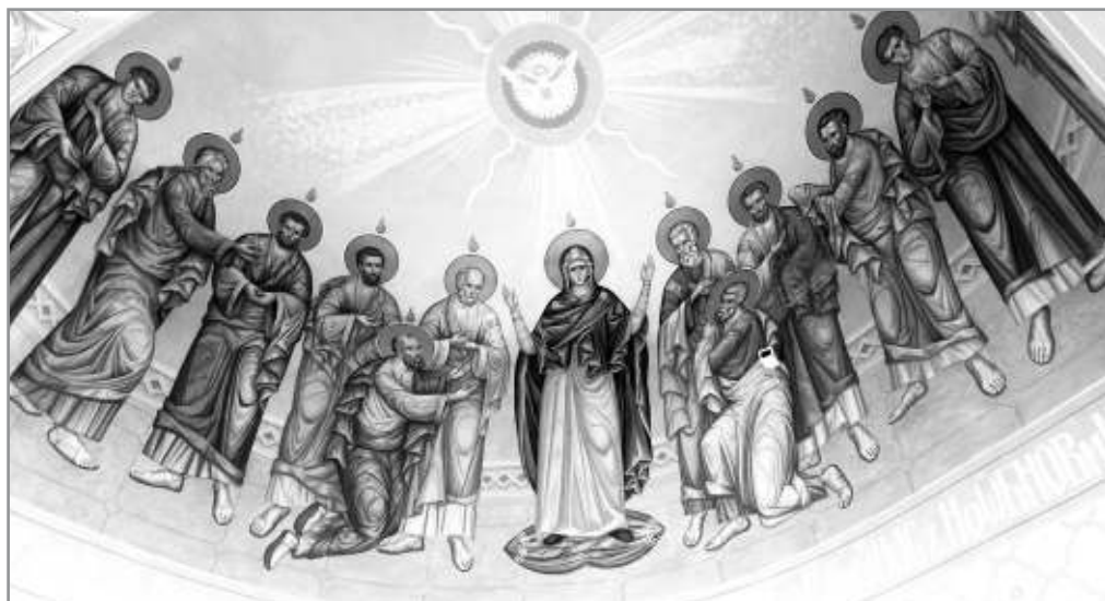
Рисунок 5. Фреска «Нисхождение Святого Духа». Алтарная часть храма Преподобного Сергия Радонежского села Новосергиевка

Иконографическая традиция явственно видна и в строгой, несколько вытянутой пропорции фигур на фреске правого придела «Положение во гроб» (рисунок 8) [2].