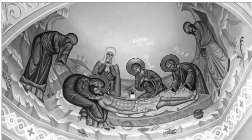
Рисунок 8. Фреска «Положение во гроб» из правого придела храма Преподобного Сергия Радонежского села Новосергиевка