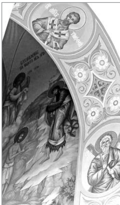
Рисунок 7. Несколько «поясных» фигур из правого придела храма Преподобного Сергия Радонежского села Новосергиевка

Таким образом, именно использование традиций русской храмовой живописи, и, в частности, стиля мастера иконописи XVII Гурия Никитина, позволяет современным мастерам воссоздать исторический контекст и выстроить гармоничные композиции образов в росписи новых храмов.