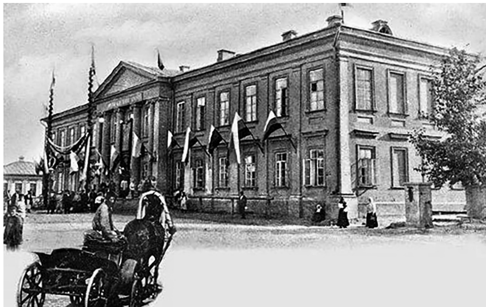
Фото 5. Здание Городской думы, г. Оренбург

пожертвований на военные нужды, стал зал Городской Думы (фото 5). Так, «18 декабря 1915 года в зале Городской думы о. ректором (архимандритом Варлаамом – авт.) был устроен платный религиозно-патриотический вечер, на котором было чтение о. ректора „Настоящая мировая война народов“ и хор воспитанников семинарии исполнил религиозно-патриотические песнопения. Чистого дохода с вечера – 122 р. 80 к. Деньги были переданы в Оренбургский отдел Всероссийского общества попечения о беженцах» 42 .