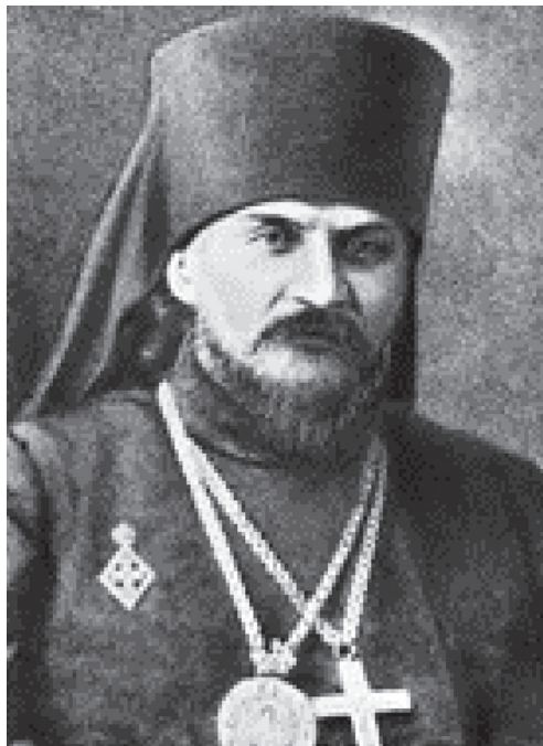
Фото 1. Анастасий (Александров), епископ Ямбургский

тот факт, что «пожертвования в пользу раненных и пострадавших от войны текут рекой; люди, отказывающие себе во всём и жертвующие всем своим достоянием, перестали быть редким исключением! А те, кто не имеют денежных средств, отдают на общее дело свой труд» 12 .