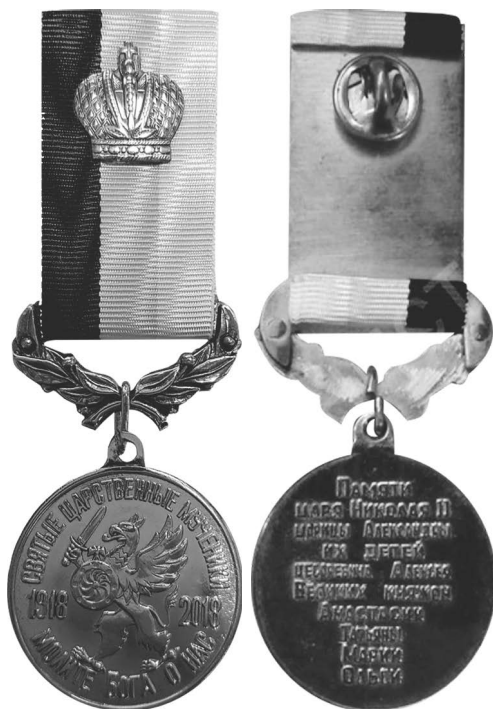
Фото 7. Аверс* и реверс** медали «К 100-летию мученической кончины Царской Семьи» (Россия, 2017 г.)

*К 100-летию мученической кончины Царской Семьи // Духовно-просветительский центр Сестрорецка : сайт. URL: https://www.sestroretsk.com/400-letiju-doma-romanovykh/72539/ (дата обращения: 20.01.2024).