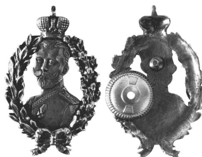
Фото 29. Аверс и реверс знака «Николай II» (Россия, 2010–2020-е гг.) **

**Знак с портретом Николая 2 в венке // Мешок: интернет-аукцион : сайт. URL.: https://meshok.net/item/302946533_знак_значок_Знак_с_портретом_Николая_2_в_венке (дата доступа: 20.01.2024).