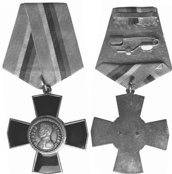
Фото 12. Аверс и реверс памятного знака «Святой Николай II» (Россия, 2010-е гг.) **

Ещё один знак в форме креста на пятиугольной колодке появился в 2010-е гг. Как и орденский знак «Император Николай II», он повторял очертания Георгиевского креста, был изготовлен из латуни и покрыт тёмно-синей эмалью. В центре знака располагался круглый медальон с изображением профиля императора Николая II с круговой надписью: «Святой Николай II» (фото 12). Знак крепился к пятиугольной колодке,