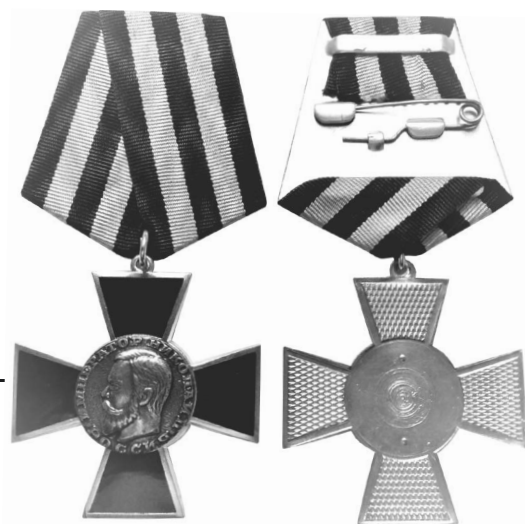
Фото 3. Аверс и реверс орденского знака «Император Николай II» (Россия, 2017–2018 гг.) *

*Россия. Император Николай II // Мешок: интернет-аукцион : сайт. URL: https://meshok.net/item/96534412_Россия_Император_Николай_II (дата обращения: 20.01.2024).