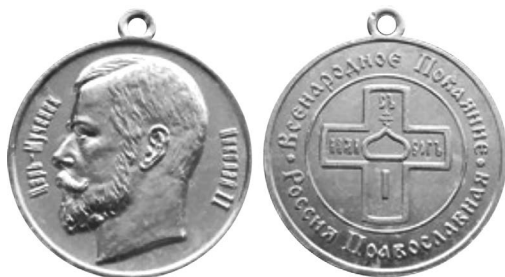
Фото 23. Аверс и реверс памятной медали «Всенародное Покаяние» *

*Медаль Церковная Царь Мученик Николай 2. Всенародное Покаяние // Мешок: интернет-аукцион : сайт. URL: https://meshok.net/item/328554426 ; Памятная медаль «Всенародное покаяние» // Россия Православная : сайт. URL: https://rosprav.ru/o-dvigenii/nagradnaya-simvolika/pamyatnaya-medal-vsenarodnoe-pokayanie/ (дата обращения: 20.01.2025).