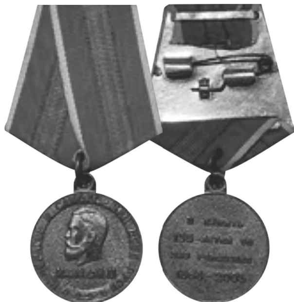
Фото 25. Аверс и реверс медали, посвящённой 135-летию со дня рождения императора Николая II (Россия, 2003 г.) *