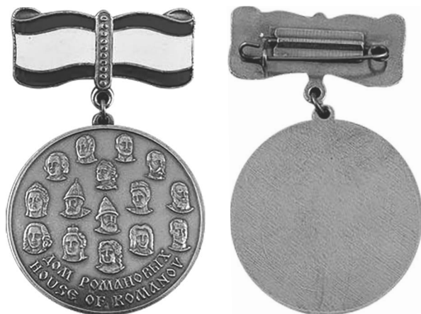
Фото 11. Аверс и реверс медали «Дом Романовых» (Россия, 2010-е гг.) *

*Медаль Дом Романовых / House of Romanov // Мир фалеристики – 2024. URL: https://www.mir-faleristiki.ru/catalog/prodazha-medaley-raznih-komplektov/medal-dom-romanovykh-house-of-romanov.html (дата обращения: 20.01.2024).