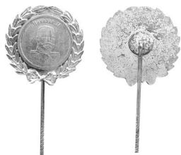
Фото 30. Аверс и реверс фрачного знака «Николай II» (Россия, 2010-е гг.) *

*Знак Николай 2 серебро самоделка // Мешок: интернет-аукцион : сайт. URL: https://meshok.net/item/306552641_Знак_Николай_2_серебро_самоделка (дата обращения: 20.01.2024).