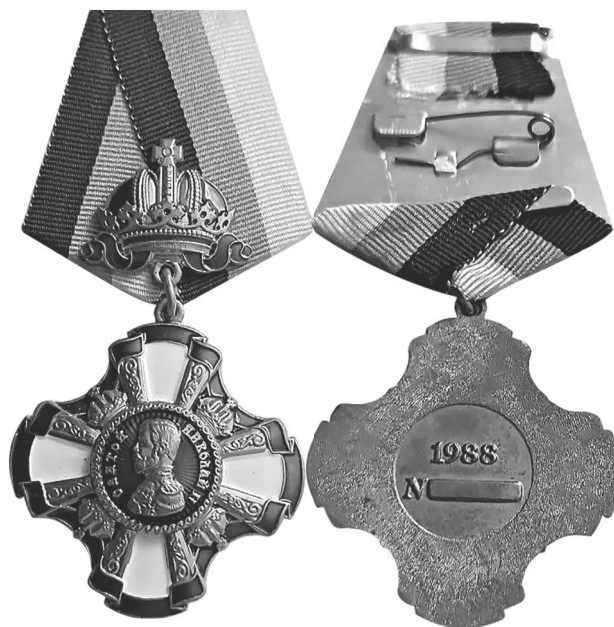
Фото 14. Аверс и реверс ордена I степени «Святой Николай II» (Украина, 2010-е гг.) *

*Святой Николай II – Высшая международная награда. Учреждена «Императорское общество России» тм // Auction.ru : сайт. URL: https://auction.ru/offer/svjatoj_nikolaj_ii_vyshshaja_mezhdunarodnaja_nagrada_uchrezhdena_imperatorskoe_obshchestvo_rossii_tm-i294813423685861.html (дата обращения: 20.01.2025).