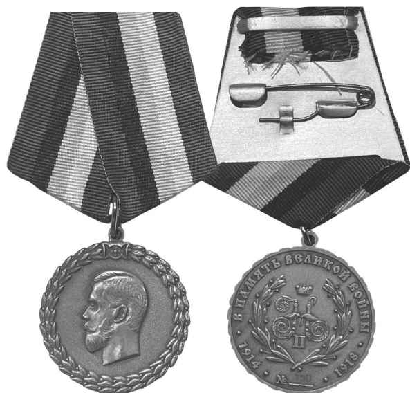
Фото 18. Аверс и реверс юбилейной медали «В память Великой Войны» (Россия, 2014 г.) *