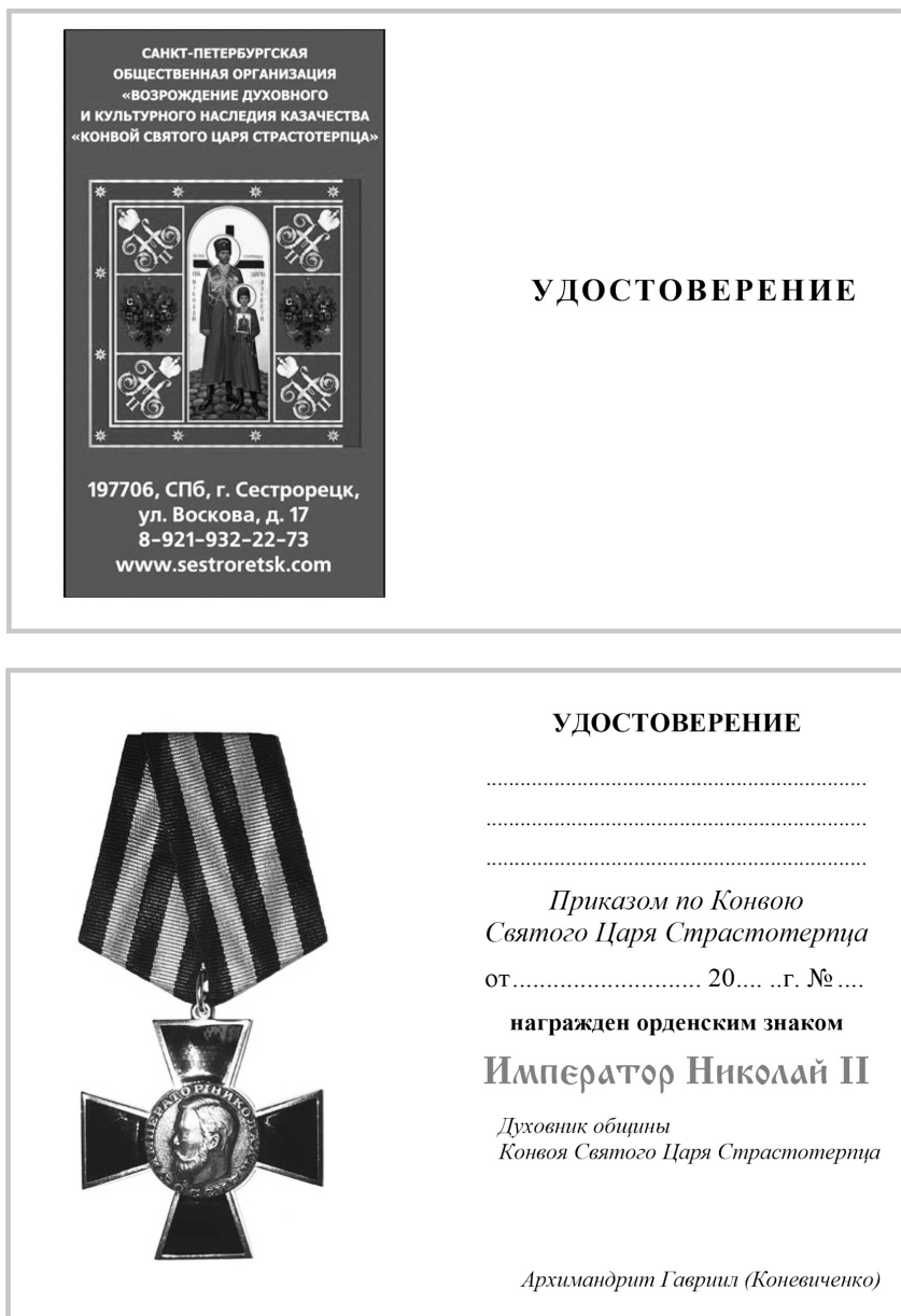
Фото 4. Бланк удостоверения к орденскому знаку «Император Николай II» (Россия, 2017–2018 гг.) *