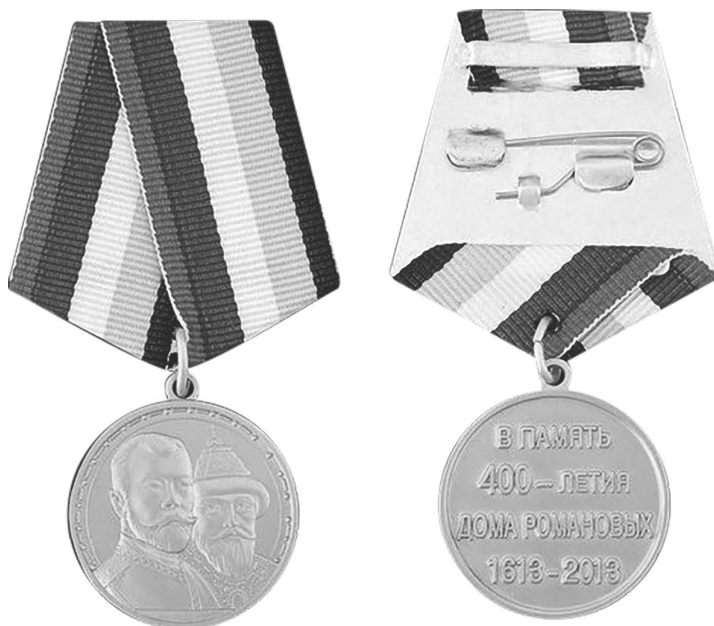
Фото 8. Аверс и реверс медали «400 лет Дому Романовых 1613–2013» (Россия, 2013 г.) *

*Медаль 400 лет Дому Романовых // Мир фалеристики – 2024. – URL: https://www.mir-faleristiki.ru/catalog/rossijskaya-imperiya/medal-v-pamyat-400-letiya-doma-romanovykh-1613-2013.html (дата обращения: 20.01.2024).