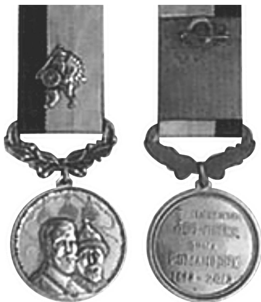
Фото 5. Аверс и реверс памятной медали «В память 400-летия Дома Романовых 1613–2013» для награждения казаков, с куполами на заднем плане аверса (Россия, 2013 г.) *

*Россия. Величко А. М., Величко А. А. Казачий медальер Тюмени. Гродно: Крокус, 2014. С. 48.