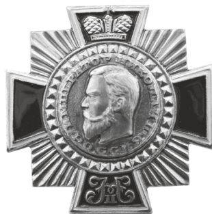
Фото 2. Памятный нагрудный знак «Император Николай II» (Россия, конец 1990-х гг. – первая половина 2000-х гг.) *

Вариант орденского знака «Император Николай II» на колодке (фото 3). вручался в связи с памятными событиями: «100-летием трагической гибели Российской Империи (2017); 150-летием со дня рождения Государя Императора Николая II Александровича (2018); 100-летием мученического подвига Царской Семьи (2018). ... Орденский знак „Император Николай II“ вручается соратниками и миссионерами Духовно-просветительского центра города Сестрорецка Санкт-Петербурга по благословению духовника „Конвоя Памяти Государя Императора Николая II“ архимандрита Гавриила (Коневиченко) и за его подписью за верноподданнические чувства и любовь