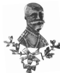
Фото 28. Серебряный знак «Николай II» (Россия, 2010 г.) *

*Знак, значок серебро 925. Николай 2. Винт. // Интернет-аукцион и торговая площадка Мешок: интернет-аукцион : сайт. URL.: https://meshok.net/item/304160966_Знак_значок_серебро_925_Николай_2_Винт (дата доступа: 20.01.2024).