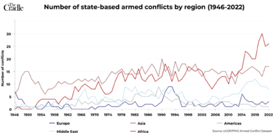
Рисунок 5. Количество государственных вооружённых конфликтов по регионам (1946–2022)

Итак, прошло более 300 лет с момента рождения Канта, но его идеи остаются важными и применимыми в современных международных отношениях. Он предлагал практические решения для предотвращения войн и сохранения мира. Возможно, современные конфликты, такие как кризис на Ближнем Востоке или войны в Африке, могли бы быть решены через внедрение его идей о республиканском правлении и федерации государств. Однако на данный момент можно засвидетельствовать печальный тренд – количество конфликтов в мире с момента окончания Второй мировой войны только растёт (Рисунки 5, 6), что говорит о необходимости более тщательного изучения наследия философов прошлого и реализации их идей на практике.