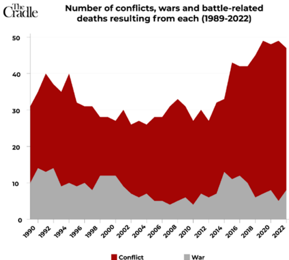
Рисунок 6. Количество конфликтов, войн и смертей на поле боя в их результате (1989–2022)

людей... Но необходимо, чтобы все вместе захотели такого состояния» 19 . Для этого необходимо искоренить фундаментальные причины войн, такие как борьба за власть и стремление к экономическим выгодам, что представляется трудно выполнимым.