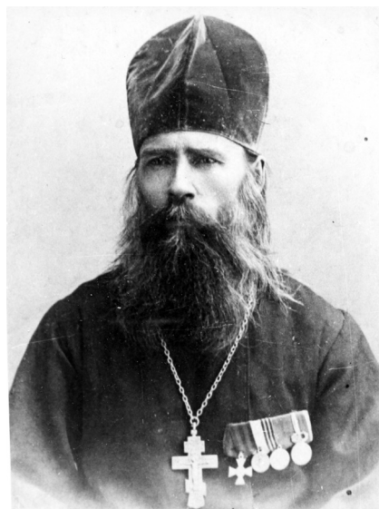
Фото 7. Неизвестный оренбургский священник с Георгиевским крестом

4 июня 2023 года в райцентре Новоорск были открыты пять памятных досок с именами 136 казаков, героев Первой мировой войны. Четыре доски в основании обновлённого памятника выполнены в форме Георгиевского креста, пятая – с именами полных Георгиевских кавалеров укрепленна на двухметровой стеле 41 .